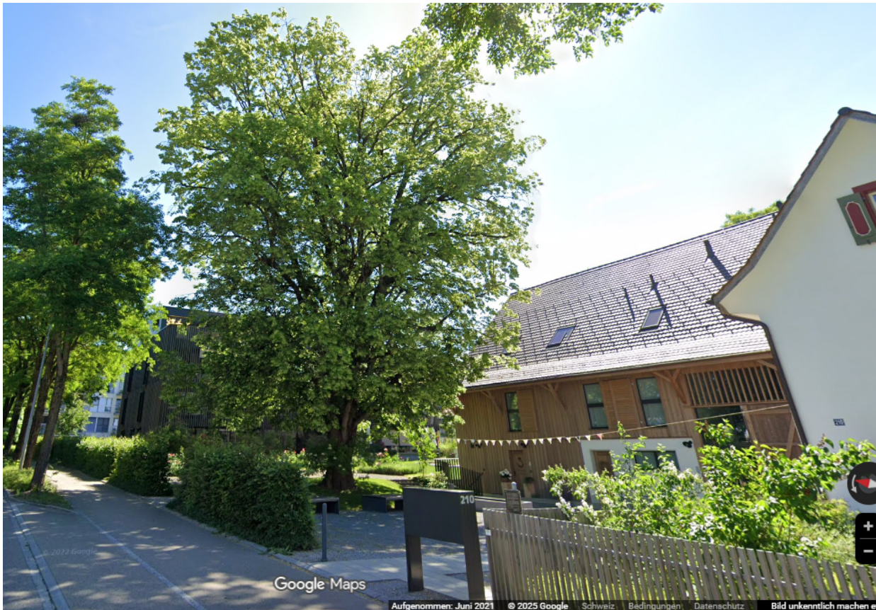
Abb. 1: Sommer-Linde NLI 4.08 im Juni 2021, vor dem Ausbruch eines Kronenteils.

Nach einem Ausbruch eines grossen Kronenteils bei einem Sturm im Juli 2021 wurde der Baum durch die Baumpflegfirmen Baumläufer GmbH und Baumpflege Barbara Willi begutachtet. Die Linde wurde damals als erhaltenswürdig eingestuft, aus Sicherheitsgründen musste die Krone aber stark eingekürzt werden.