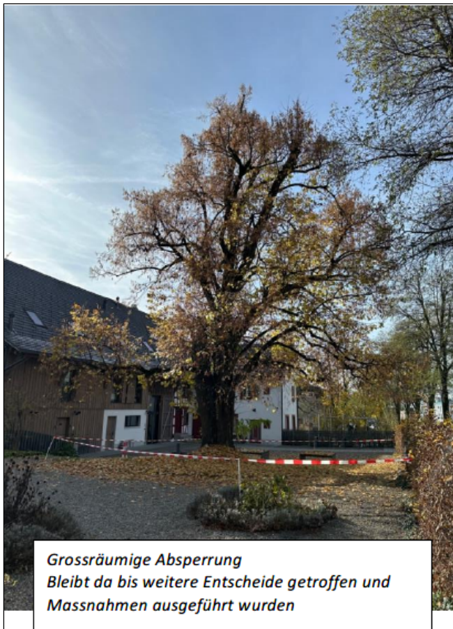
Abb. 2: Zustand der Sommer-Linde nach dem Astabbruch im Oktober 2025.