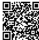
Google Play Store